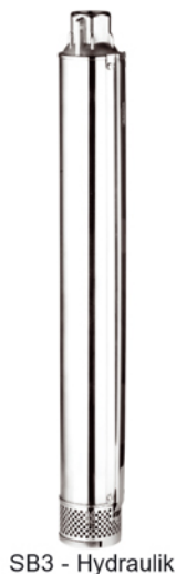
SB3 - Hydraulik